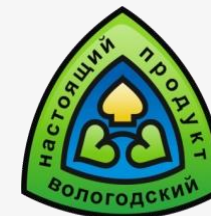
真正的 沃洛格达产品