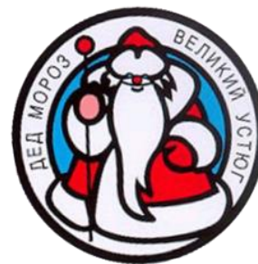
冰雪老人 来自大乌斯秋格