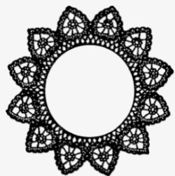
沃洛格达蕾丝花边