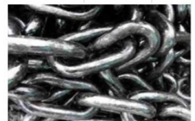
Mooring chain Grade 40